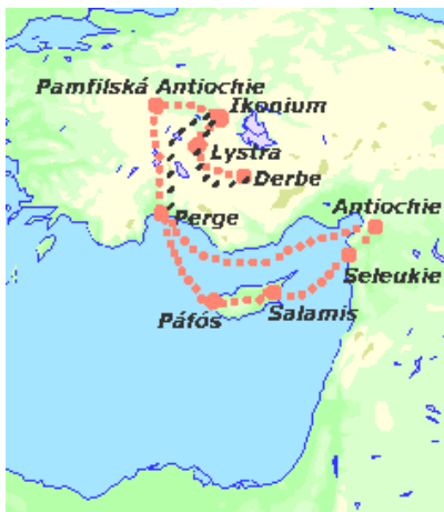
Mapa východného Stredomoria s vyobrazením Pavlovej 1. cesty

Prví kresťania prišli do Antiochie v čase prvých prenasledovaní: Tí, čo sa rozprchli pred súžením, ktoré nastalo za Štefana, došli až do Fenície, na Cyprus a do Antiochie, ale nikomu neohlasovali slovo, iba Židom (Sk 11, 19). Prvým organizátorom komunity v Antiochii s poverením od cirkvi v Jeruzaleme bol Barnabáš (por. Sk 11, 22), ktorý vyhľadal Pavla a zobral ho za svojho spolupracovníka. Práve títo dvaja dostávajú neskôr od komunity a Ducha Svätého nové poslanie. Položenie rúk, ako svedčí text v Sk 13, 2-3 počas liturgie, neznamená vysviacku, ale skôr požehnanie pred dôležitým poslaním. Z Antiochie odchádzajú do Seleucie, ktorá bola prístavným mestom Antiochie. Prístav Seleucia sa nachádza asi 10 km od Antiochie. Bol dôležitým vojenským a obchodným prístavom pri ústí rieky Orontes. Seleucia sa pôvodne nazývala Paleopolis, čo v preklade znamená Staré mesto . Mesto založil Seleucid I.-Nikator okolo r. 310 pred Kristom. Z tohto prístavu Barnabáš a Pavol vyplávali smerom na Cyprus v spoločnosti Jána Marka.